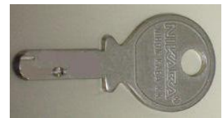
日本カバ社製のディンプル錠